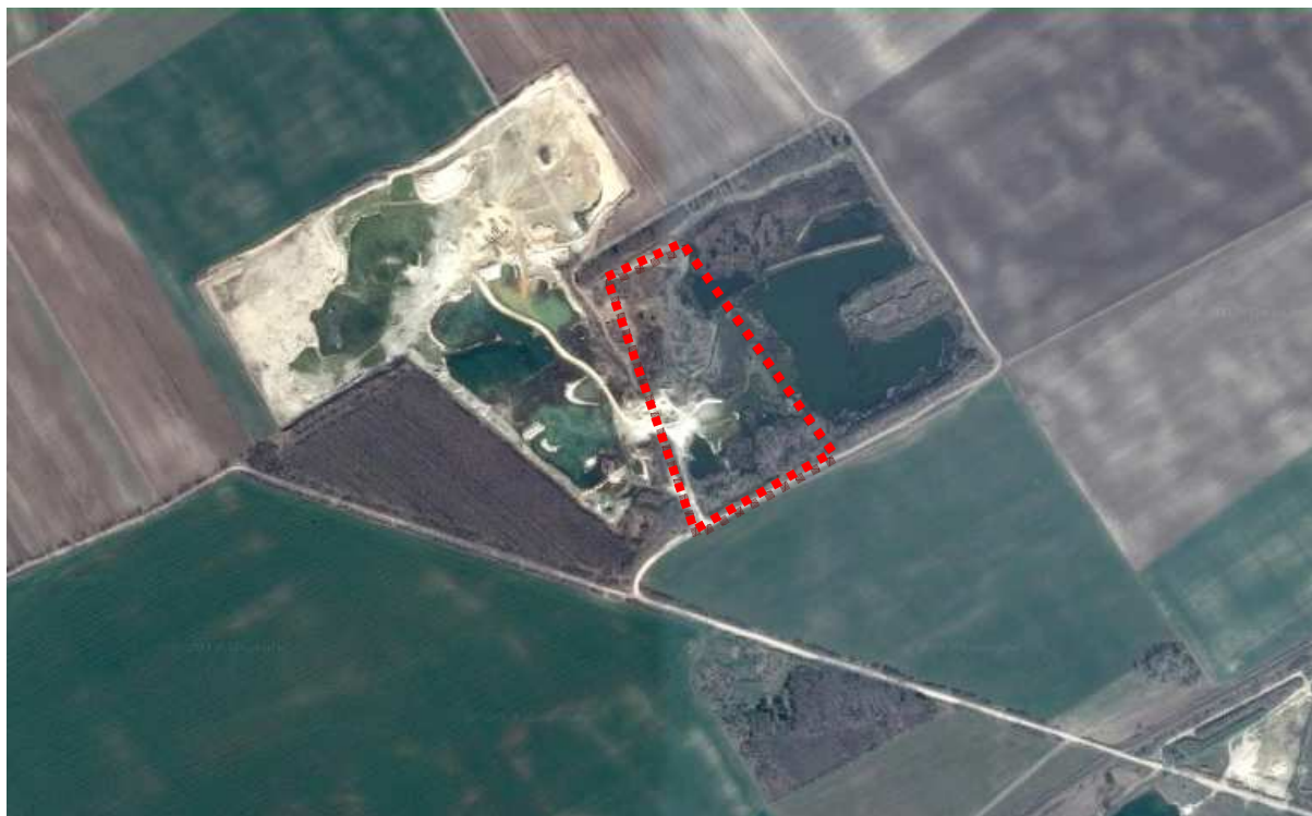
A módosítással érintett terület

A módosítás célja a 0547/2 hrsz.-ú felhagyott kavicsbánya hatályos településrendezési eszközök szerint (tervezett) erdőterületének beépítésre nem szánt különleges terület–inert hulladékkezelő sajátos területfelhasználási egységbe történő átsorolása. A módosítással lehetőség nyílik egyrészt az inert hulladék kezelésére és egyben a bányaterületek rekultivációjára. Az érintett telek művelésből kivett, kavicsbánya besorolású.