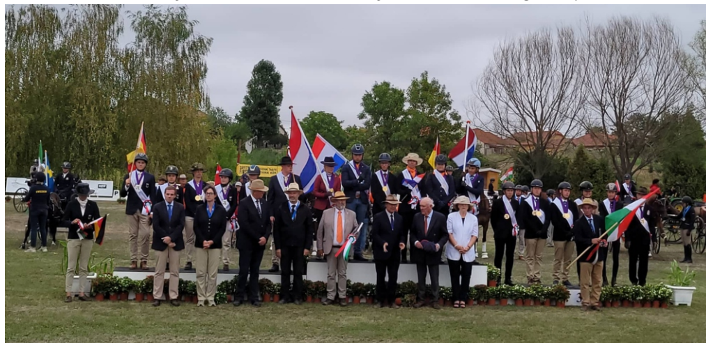
Eredményhirdetés, a hivatalos személyek és a három dobogós csapat.

További sportsikereket, szép eredményeket kívánunk!